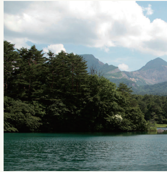
3: 五色沼 (イメージ)