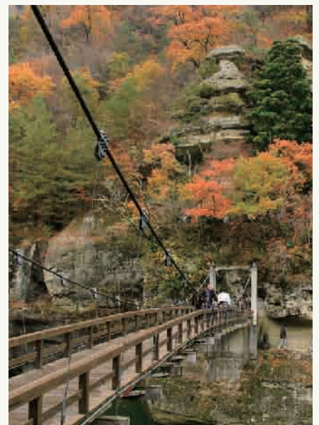
12: 塔のへつり (イメージ)