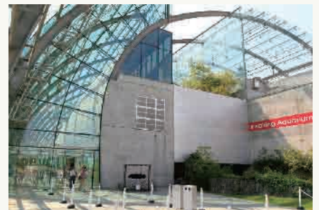
10: アクアマリン福島 (イメージ)

福島県の魅力あふれる中通～会津地方を2日間で巡るハイライトコースです。南会津町にある前沢曲家集落は、現在大内宿と並び日本の原風景の心ふるさと言われております。集落の民家の大半は茅葺屋根であり、集落内の曲家資料館では、曲家の内部を見学できます。会津の主要観光地である、塔のへつり、大内宿、鶴ヶ城などをめぐります。2日目は、福島県の大迫力の絶景ポイントが目白押しである、「磐梯山ゴールドライン」「磐梯吾妻レークライン」の2コースをめぐります。森と湖、渓谷が織りなすレークラインを堪能できるコースになっております。