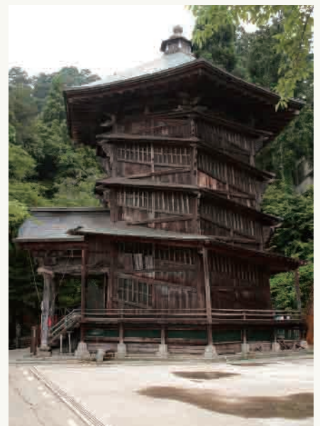
5: さざえ堂 (イメージ)