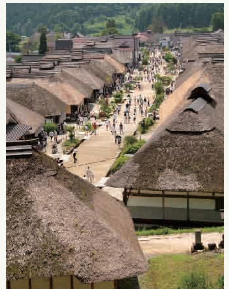
4: 大内宿 (イメージ)

間近に迫る磐梯山と猪苗代の大パノラマを楽しめる磐梯山ゴールドラインは、秋の紅葉シーズン人気の高原道路です。幻想的でもあり神秘的に彩りを変える五色沼郡散策は裏磐梯観光を代表するコースです。国の指定重要文化財である天鏡閣は、明治40年8月、有栖川宮威仁親王殿下が東北地方ご旅行中、猪苗代湖畔を巡遊され、その風光の美しさを賞せられてこの地に御別邸を建設することを決定されました。気品あるルネッサンス風洋風建築であり、本館は、2階建て天然スレート葺きの八角塔屋付きで外観は変化に富んでおります。