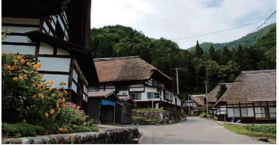
9: 前沢曲屋集落 (イメージ)