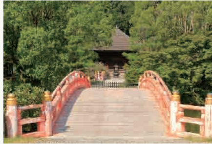
8: 白水阿弥陀堂 (イメージ)