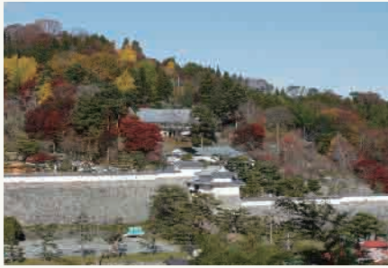
1: 紅葉の霞ヶ城公園 (イメージ)

会津地方、中通り、浜通りの3つのエリアに分かれているふくしま。豊かな大自然と会津藩士ゆかりの名所旧跡が点在する会津地方、美しい花々とみずみずしい果実がいっぱいの中通り、そして太平洋に面し、雄大な景観を望める浜通り。3エリアはそれぞれ魅力的であり、訪れる人に驚きと感動を与えます。ぜひ魅力溢れるふくしまの旅をご満喫ください。