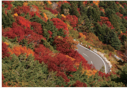
2: 磐梯吾妻スカイライン (イメージ)