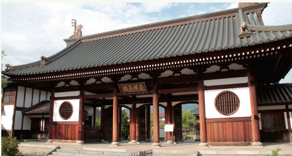
6：会津藩校日新館 (イメージ)

昨年ドラマのヒロインとして注目された新島八重のふるさとでもある会津若松をじっくりと巡ります。城下町会津若松のシンボルである鶴ヶ城は、昭和40年に再現されました。東西に800mの通りである七日町通りは、大正浪漫を感じる通りとなっております。戊辰戦争にて非情の死をとげた場所としてしられる飯盛山には、隊士の墓と自刃の地があります。さざえ堂は、六角三層のつくりになっており、上りと下りが全く別の通路である一方通行になっており、独特な二重らせんスロープで国の重要文化財にも指定されています。会津武家屋敷は、7,000坪の広大な敷地内に復元した家老屋敷をはじめ、さまざまな歴史的建造物が立ち並ぶ歴史ミュージアム。日新館は八重の兄猿馬や白虎隊士の学び舎である会津藩校日新館は当時の学びの風景以外に会津の教養も学ぶことができます。