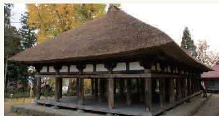
7：熊野大社(長床) (イメージ)

明治37年(1904)鉄道開通に伴い、レンガの工場が多く建てられた喜多方市。酒や味噌などの醸造業が盛んで保存に最適な蔵が数多く残っています(約4,200棟)。蔵を生かしたレストランやショップなどもあり、蔵ならではの雰囲気を楽しめます。熊野神社長床は、天喜3(1055)年に源頼義・義家親子が勧請した古寺です。拝殿長床は、藤原時代の寝殿造・主殿形式をふみ、壁も窓もない吹き抜けの空間に円柱が5列も並ぶさまは壮観です。徒歩の散策が多いコースです。歩きやすい観光でご参加ください。