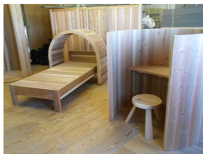
杉木ロスリット材製品

本セミナーは平成27年度補正予算 林野庁地域材利用拡大緊急対策事業の助成を受けています。